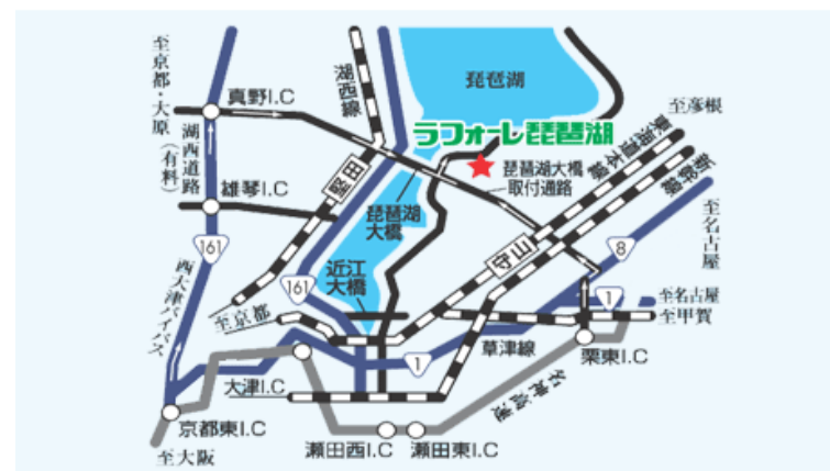
ラフォーレ琵琶湖 交通案内図